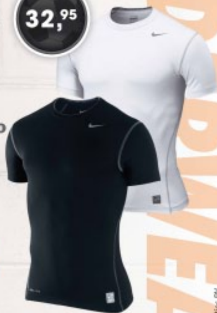
NIKE PRO SHIRT